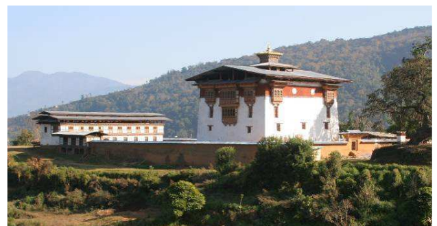
Monastère proche du village

A Capjisa, la religion est pratiquée par tous les habitants, qui côtoient régulièrement des moines qui les guident dans leur spiritualité. Plusieurs villageois ont eu l'occasion de faire un pèlerinage en Inde pour visiter des lieux sacrés du bouddhisme et rencontrer le Dalaï Lama.