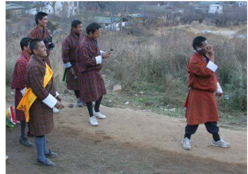
Concours de fléchettes en habit traditionnel

Les habits traditionnels sont le go pour les hommes, et la kira pour les femmes. Le premier s'arrête à hauteur des genoux alors que la version féminine descend jusqu'aux chevilles. Ils sont toujours portés lors de certaines occasions comme les fêtes, les déplacements à la ville, la visite d'un dzong, etc.