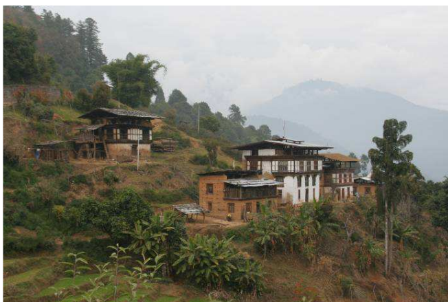
Village de Capjisa

Le village est composé de 380 maisons en bois et enduit de terre, dispersées dans la montagne. Il est situé en bordure d'une route en terre qui rallie le village à Punakha, ancienne capitale du Bhoutan, et aux autres villages alentours. Il est entouré de rizières et de forêts.