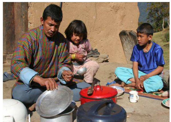
Repas cuisiné et servi par le père de famille

Les mariages sont généralement libres dans cette région du Bhoutan. Les villageois se marient souvent vers 20 ans et peuvent trouver mari ou femme à l'extérieur du village. Il n'y a pas de système de dot , ce qui explique sans doute le fait qu'il n'y ait pas de discrimination de sexe à la naissance, comme c'est le cas dans les pays voisins. Après le mariage, c'est l'homme qui vient vivre chez les parents de son épouse, ce qui est très rare en Asie. Le divorce est possible et accepté culturellement.