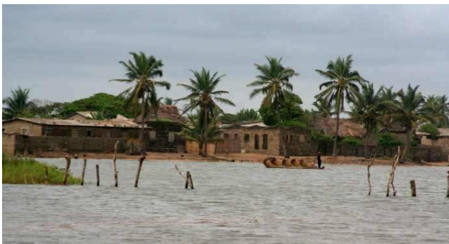
Village de Agonin Kanmé

Au sein de la commune de Grand Popo , Agonin Kanmé est un village peuplé principalement de pêcheurs traditionnels. Suite à diverses modifications géologiques et notamment la présence de sable dans le fleuve Mono, le nombre de poissons a considérablement diminué depuis une cinquantaine d'années. Ce facteur, ajouté à un accès difficile du village fait que le village se dépeuple de plus en plus. En 2010, énormément de maisons étaient abandonnées.