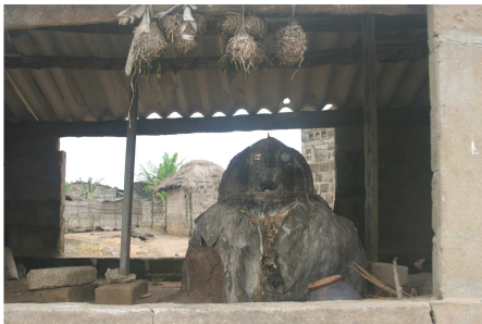
Fétiche à l'entrée du village

Dans le village, il existe un groupement d'initiés qui connaît le « Zangbeto », esprit gardien de la nuit. A partir du coucher du soleil, il est interdit de se déplacer dans certaines zones du village sans être initié, sous peine de se voir infliger une amende par le clan.