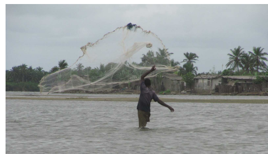
Pêche à l'épervier aux abords du village

Plusieurs habitants possèdent des palmeraies (sur une île du fleuve ou plus à l'intérieur des terres). Les noix de coco récoltées sont en partie consommées par les habitants, en partie transformées pour fabriquer de l'huile de coco, et en partie vendues. Les coques fibreuses sont utilisées comme combustibles.