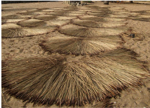
Séchage des herbes avant confection des nattes

dans les marécages du fleuve. Ils vendent des bottes de joncs séchés ou des paniers et des nattes au marché voisin. Il faut un mois de travail pour tresser une large natte, qui est vendue 5000 francs (7,5€).