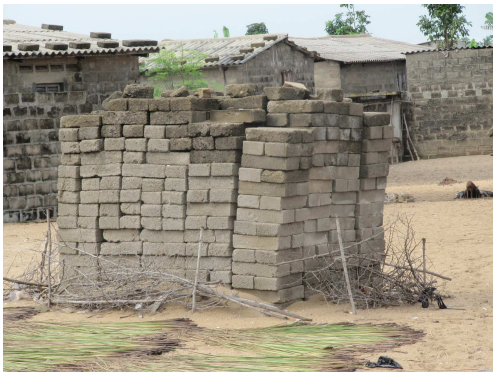
Tas de moellons sur fond de maisons moches

Actuellement, il reste seulement une dizaine de maisons en argile dans le village. Le plus fréquent est l'utilisation d'un mélange ciment et sable pour les fondations, les blocs ciment et le mortier). Il faut environ 6 tonnes de ciment pour la construction d'une maison moyenne. Les toits sont en fibro-ciment. Le ciment coûte cher pour ces villageois ; c'est grâce au travail des jeunes partis à l'aventure hors du village qu'ils ont pu construire ces maisons plus solides.