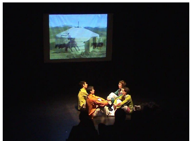
En train pour la Mongolie !