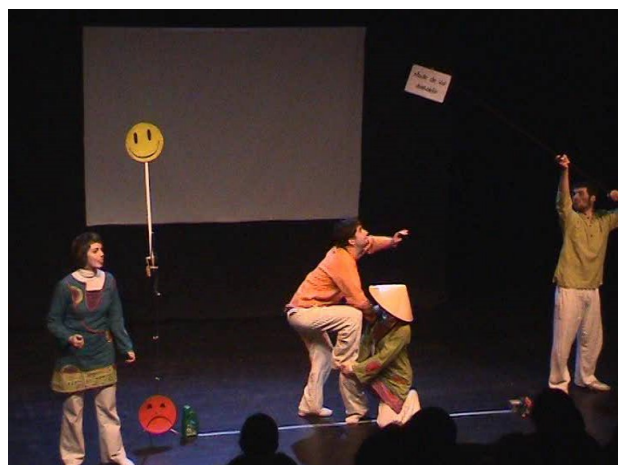
Notre mode de vie moderne peut-il tendre vers un mode de vie durable?