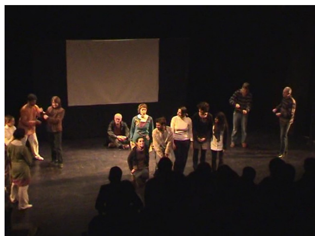
Le public est invité à reconstituer une grande famille africaine sur scène