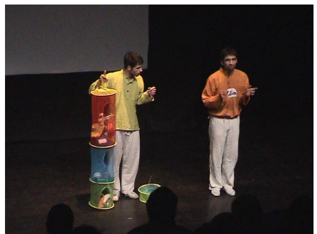
Le professeur explique les impacts des modes de vie sur l'environnement